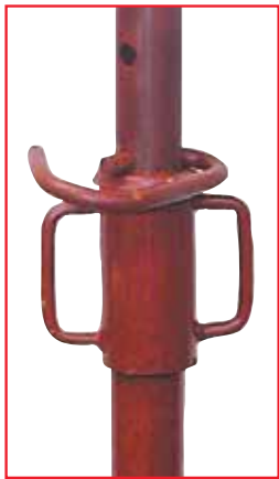
Stalen handvat met schroefdraad Manchon de réglage en acier soudé